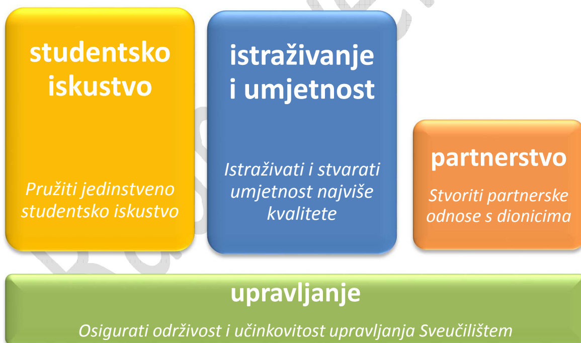
Shema 2. Strateški prioriteti Sveučilišta Jurja Dobrile u Puli

Temeljni su prioriteti vezani za djelatnosti Sveučilišta – studentsko iskustvo, istraživanja i umjetnost, a njihovo ostvarenje moguće je samo uz potporne prioritete – partnerstvo i upravljanje. Pojam student odnosi se jednako i na polaznike ostalih obrazovnih programa Sveučilišta.