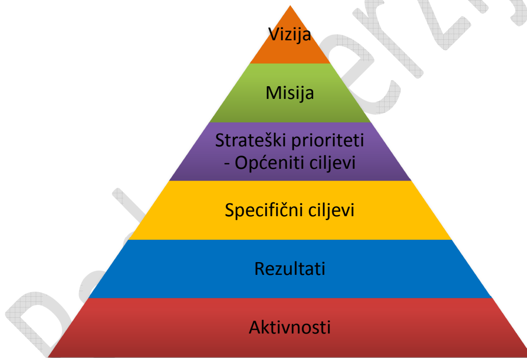
Shema 1. Hijerarhija strateških elemenata u strategiji Sveučilišta Jurja Dobrile u Puli

Elementi logičke matrice unutar ove strategije omogućavaju razradu pojedinačnih strategija koristeći se također logičkom matricom kao alatom na svakoj od sastavnica Sveučilišta, pri čemu specifični cilj ili pojedina aktivnost u strategiji Sveučilišta može postati viša hijerarhijska strateška razina po sastavnicama. Sastavnice u svojim strategijama moraju dokazati usklađenost svoga djelovanja i doprinos toga djelovanja ostvarenju svrhe Sveučilišta. Svaka sastavnica aktivno doprinosi ciljevima Sveučilišta i svoju strategiju usklađuje sa strategijom Sveučilišta.